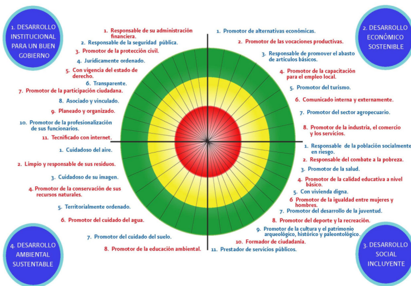
FIGURA 1 CUADRANTES DE LA AGENDA DESDE LO LOCAL (2004-2013) AUTODIAGNÓSTICO DESDE LO LOCAL 38 Indicadores para un Municipio con Calidad Aceptable

Los esfuerzos a lo largo de una década (2004-2013) se han hecho de forma escalonada por acuerdos entre autoridades de los diferentes niveles de gobierno (federal-estatal-municipal), si bien el propósito de la ADLL o programa federal de fortalecimiento de los municipios mexicanos es promover el desarrollo integral sustentable de los municipios y fortalecer las capacidades de planeación y gestión de los gobiernos locales, incluido el ámbito turístico.