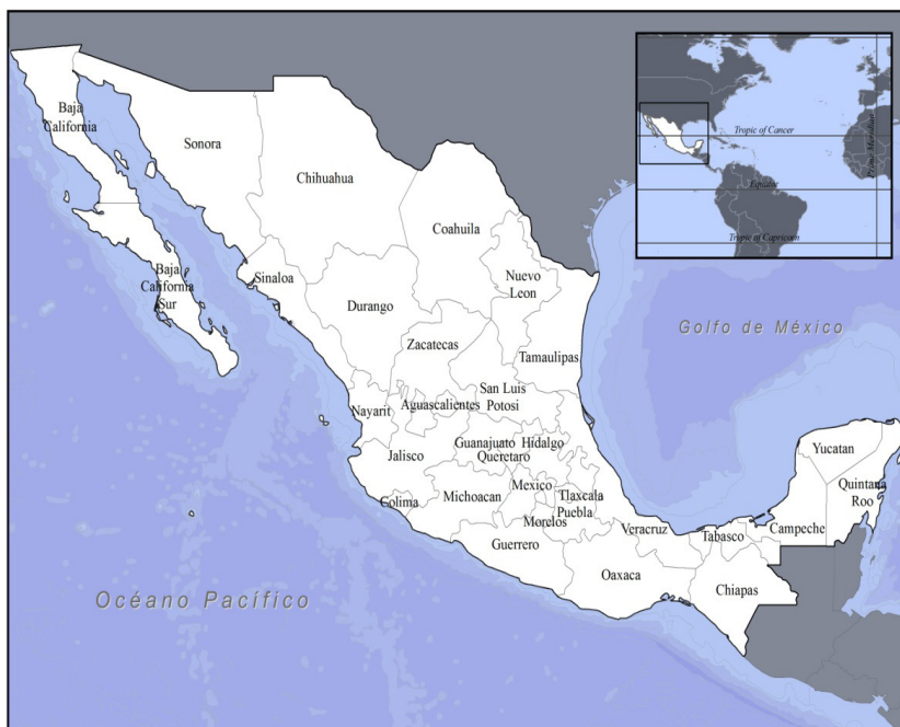
FIGURA 2 ESTADOS UNIDOS DE MÉXICO