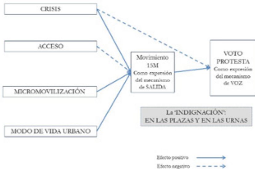
FIGURA 3 LA INDIGNACIÓN EN LAS PLAZAS Y EN LAS URNAS: FACTORES QUE FACILITAN Y ESTRATEGIAS

durante las jornadas previas a los comicios, incluso aquellos días en los que queda expresamente suspendido el derecho de reunión en un claro gesto de ‘salida’ de la organización política, es justamente el desafío que entraña esta acción lo que ha influido en la preferencia por sufragar con sentido de protesta promoviendo el ejercicio de la ‘voz’ dentro de la organización.