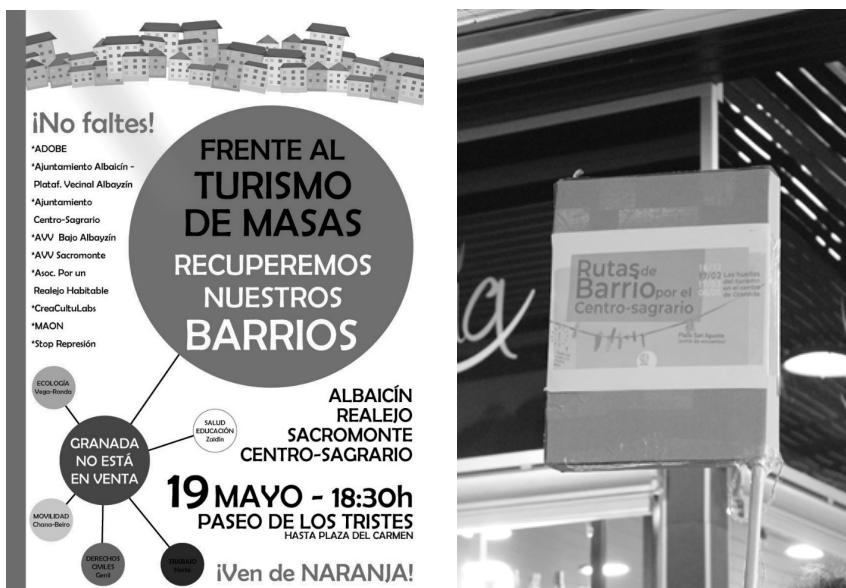
IMAGEN 1 ACCIONES DEL COLECTIVO AJUNTAMIENTOS