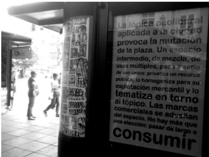
IMAGEN 2 QUIOSCO JOSÉ GUERRERO EN BIB-RAMBLA

Otra iniciativa que surgió con espíritu reivindicativo es la del quiosco gestionado por el Centro José Guerrero, dependiente de la Diputación Provincial de Granada, y que fue convertido temporalmente en un espacio de meta-reflexión acerca del concepto de plaza, como se puede ver en la Imagen 2. Y es que su localización, en Bib-Rambla, choca con el hecho de que esta simbólica y multifuncional plaza es una de las que más ha acusado la transformación del espacio público y el comercio del barrio Centro-Sagrario. En los últimos años estos característicos quioscos han pasado de ser pequeños negocios de floristería, principalmente, a tiendas repletas de souvenirs orientadas a los visitantes de la ciudad (Mingorance, 2017). Unos quioscos que además están rodeados por terrazas y veladores dispuestos en los bordes de la plaza y pertenecientes a distintos restaurantes, bares y cafés, reforzando esa orientación del carácter principal de la plaza hacia el consumo.