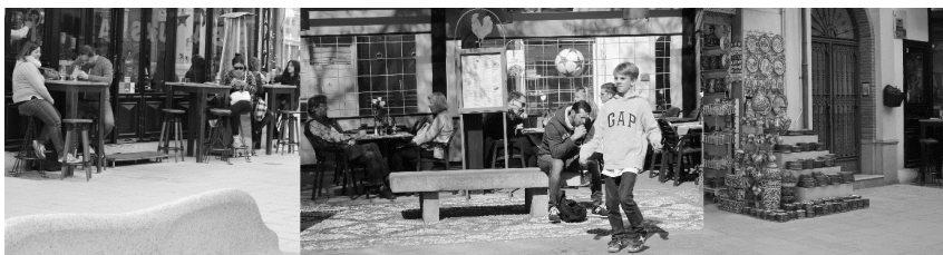
IMAGEN 4 TERRAZAS, MERCANCÍA Y BANCOS EN CENTRO-SAGRARIO

tras el primer contacto con el espacio de estudio, siguiendo las fases de investigación de la observación etnográfica que presenta Galindo Cáceres (1998). Se descubrió que estas agrupaciones eran similares en términos de capacidad, si bien el impacto visual de las mesas con estructuras es mayor que cuando no cuentan con ellas, y en ambos casos, mayor que el impacto visual de los bancos.