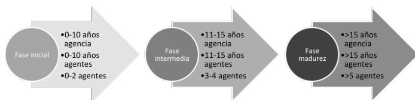
FIGURA 3 PERFIL ITINERARIO MODELO DE DESARROLLO LOCAL

Estas dos etapas desembocan en una tercera, de madurez, en la que las agencias y los/las técnicos/as con años de experiencia a sus espaldas (más de 15 como media) y con recursos humanos suficientes (más de 4 técnicos/as) y solventes, generan en muchos casos metodologías o formas de hacer propias (derivado de la ausencia institucional de las mismas), no esperando a que el modelo les facilite las herramientas. Es una fase selectiva, de ajuste, donde los objetivos se cubren desde la eficiencia operativa. Ello supone un mayor aprovechamiento de los recursos y actuaciones más integradas y acordes a las necesidades del territorio y de forma alineada con objetivos y estrategias más amplios (locales o supralocales, únicamente desde el desarrollo local o vinculados con otras áreas municipales). En esta veteranía la dualidad del modelo se relaja, pues la experiencia –el tiempo– o los recursos disponibles conducen a una visión más benevolente, menos exigente con el modelo. En la tabla siguiente se recogen las características que definen el perfil de cada una de esas etapas (Figura 3).