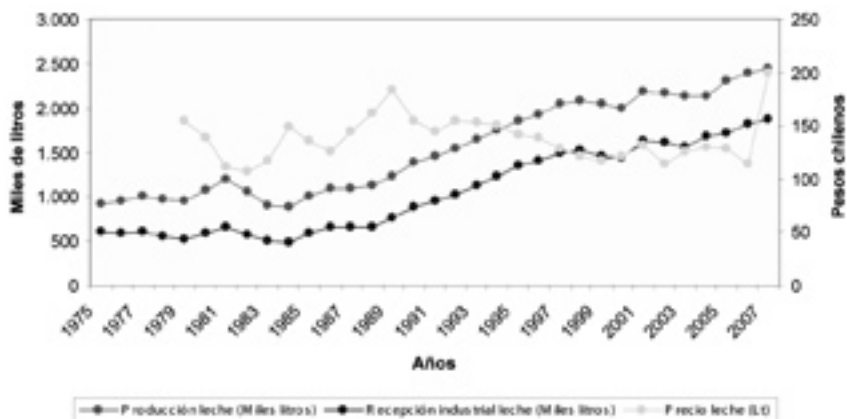
FIGURA 1 EVOLUCIÓN DE PRODUCCIÓN, RECEPCIÓN Y PRECIO DE LECHE 1979-2007

Fuente: Elaboración propia con datos del Banco Central de Chile y ODEPA.