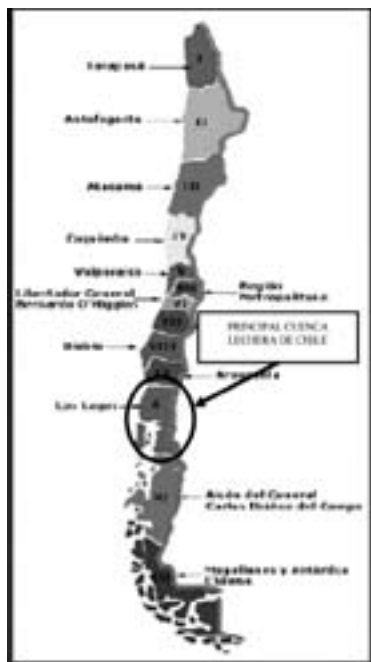
FIGURA 4 ORGANIZACIÓN REGIONAL DE CHILE Y CONCENTRACION DE LA PRODUCCIÓN LECHERA