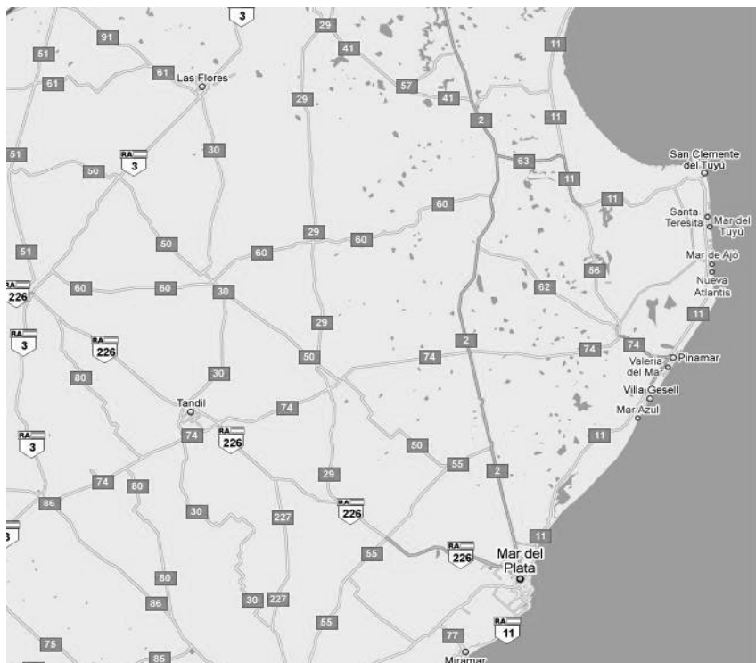
FIGURA 2 UBICACIÓN GEOGRÁFICA DE VILA GESELL Y PINAMAR