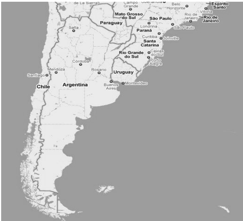
FIGURA 1 LOCALIZACIÓN DE LOS CASOS SELECCIONADOS EN LA COSTA ARGENTINA

Los casos de estudio seleccionados, Villa Gesell y Pinamar, en Argentina, permiten establecer una comparación de las relaciones interorganizacionales que subyacen en dos territorios localizados a tan sólo 25 km. de distancia (Figura 1), con escalas y características físicas similares y con un producto turístico basado en el sol y la playa, pero con diferentes tipos de demanda y un desarrollo de la oferta orientado a tales flujos. En este sentido, la investigación permite identificar características específicas en las lógicas de interacción entre los actores públicos y privados implicados en el desarrollo turístico en destinos que a simple vista se conciben semejantes pero que en su interior albergan realidades diversas.