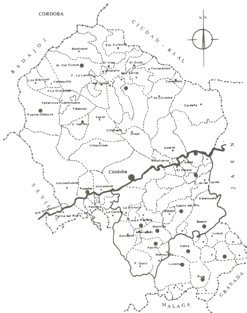
Figura. 1. Delimitación de la campiña según límites de términos municipales.